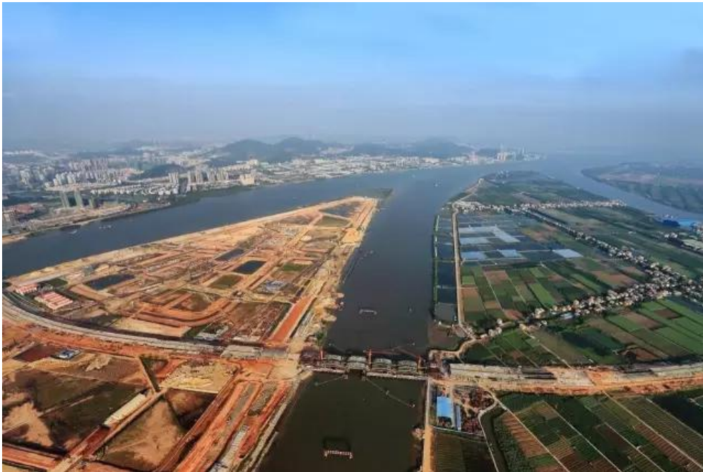
图：建设中的明珠湾区

与路网一同铺开的，是明珠湾起步区的规划建设。起步区规划面积 33 平方公里，自贸片区明珠湾区块 9 平方公里位于其中。要把一片滩涂建设成为一个面向世界的平台，任务艰巨、人员短缺。然而，南沙已经站在一个新起点，处于起步腾飞的关键时期，迫切需要通过招商引资吸引一批大项目来带动、支撑，发展的步伐更是慢不得、等不起。