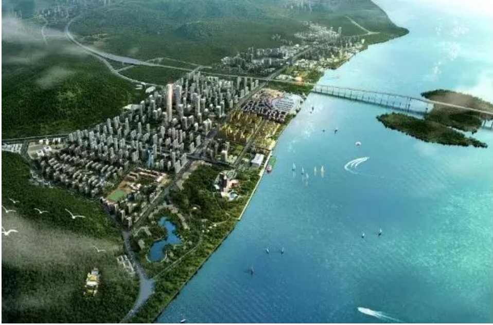
图：明珠湾区效果图

与路网一同铺开的，是明珠湾起步区的规划建设。起步区规划面积 33 平方公里，自贸片区明珠湾区块 9 平方公里位于其中。要把一片滩涂建设成为一个面向世界的平台，任务艰巨、人员短缺。然而，南沙已经站在一个新起点，处于起步腾飞的关键时期，迫切需要通过招商引资吸引一批大项目来带动、支撑，发展的步伐更是慢不得、等不起。