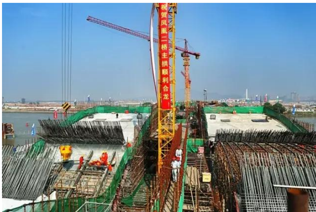
图：去年 12 月凤凰二桥顺利合拢。

俗话说，路通财通。凤凰二桥建设一度进展缓慢，纳入到明珠湾起步区灵山区块整体开发后，迅速发力，主桥结构在去年年底前合龙。凤凰二桥的建设时间十分紧迫，按照常规约需要 30 至 36 个月的工期，施工人员实现 24 小时三班倒不间断施工，压缩到仅 22 个月。