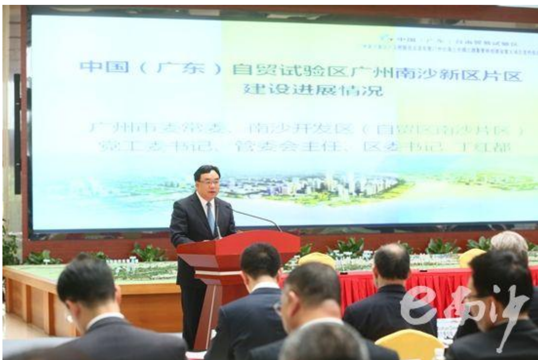
图：广州市委常委、南沙开发区（自贸试验区）管委会主任、南沙区委书记丁红都同志发布了中国（广东）自由贸易试验区广州南沙新区片区1周年开发建设情况。