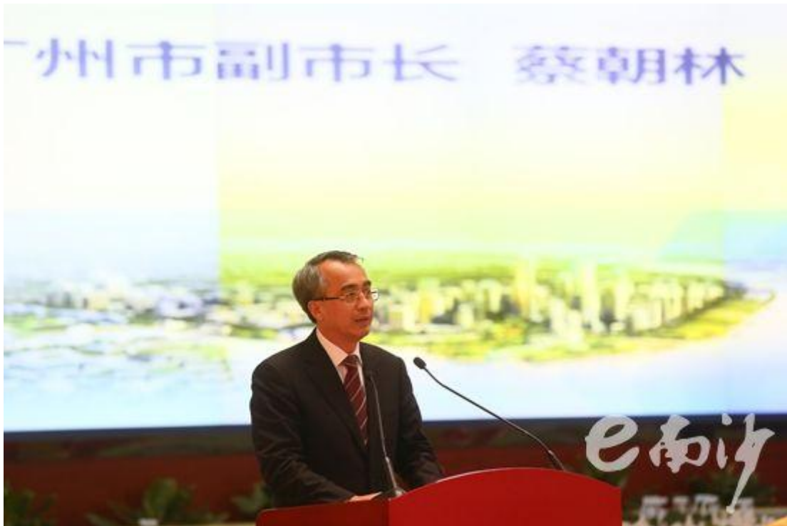
图：广州市政府副市长蔡朝林同志宣布广州国际贸易“单一窗口”2.0版上线。