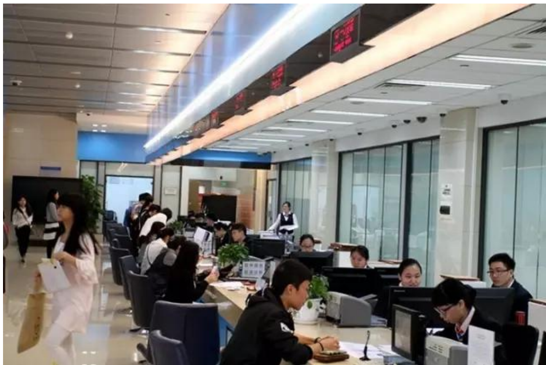
图：新升级的南沙区政务办事大厅。

整个“五一”期间，工作小组连续加了七天班，结合南沙新区规划，围绕粤港澳、先进制造业、金融创新等内容，撰写了南沙自贸试验片区总体方案。他们委托商务部相关研究院出台了一份研究报告。他们作出的第一份方案和研究院研究报告，为7月份省自贸办牵头的《中国(广东)自由贸易试验区总体方案》提供了大量的基础性内容。