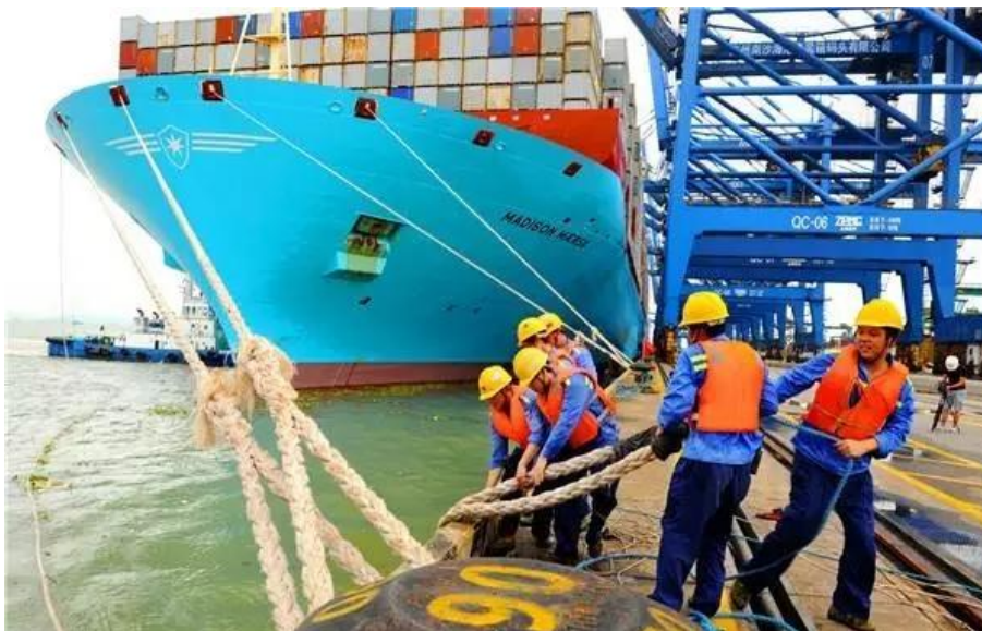
图：南沙港区的工人们正在对接靠岸的轮船。

像这样热火朝天的建设场景，密集分布在南沙区大小重点项目建设工地上。坐拥国家新区和自贸试验区“双区”优势叠加的南沙，建设者们抱着你追我赶的激情，将南沙这块巨大的工地转化为投资的热土。