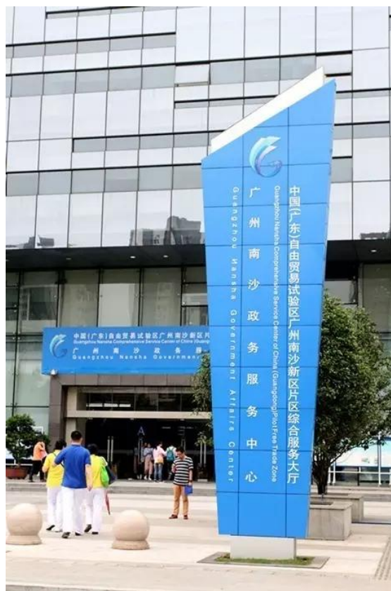
图：新升级的南沙政务服务中心。