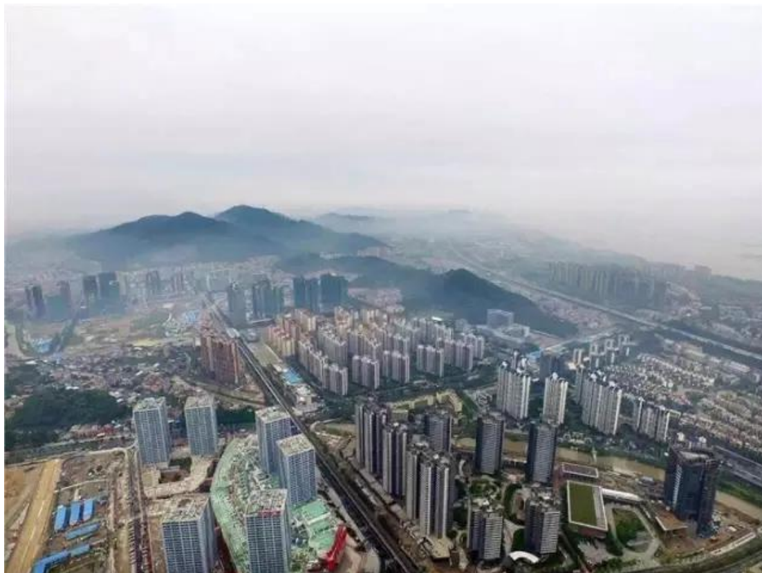
图：空中俯瞰南沙新城

“找出体制机制症结”“努力破除体制机制障碍”“要真枪真刀推进改革”，中央反复强调体制机制创新的重要意义、关键作用。